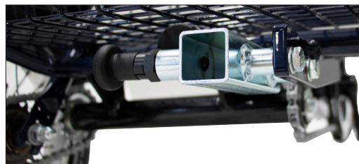
Montering på 12" och 16" har låsningen vänd åt vänster.